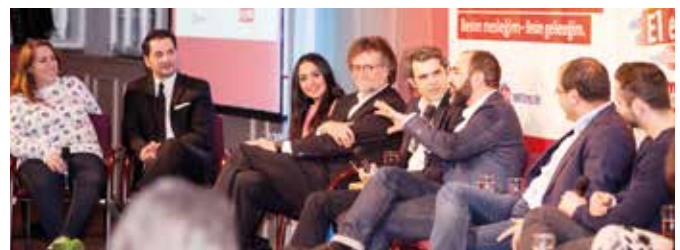
Projeye start akşamında, toplumun önde gelen isimleri, ekonomi temsilcileri ve politikacılar, göç kökenli öğrencilerin meslek seçimleri konusunda söyleşi yaptılar.