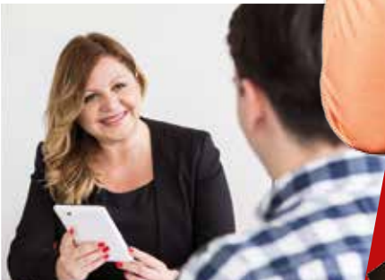
Bir meslek eğitim yerini kolayca bulmak için, AY YILDIZ danışman olarak gençlerin yanında.