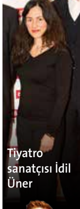
Tiyatro sanatçısı İdil Üner