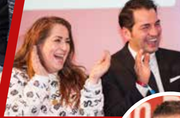
Komediyen İdil Baydar ve tiyatro sanatçısı Bülent Sharif

Göç kökenli gençler, kendilerine en uygun mesleği en çabuk nasıl bulabilirler? Berlin'deki Kalkscheune'de düzenlenen „Mein Beruf – Meine Zukunft“ - Benim Mesleğim - Benim Geleceğim projesinin start akşamında medya, politika ve toplumun önde gelen isimlerinden oluşan 200 davetli, bu konuyu konuşmak için buluştular. Tanınmış kişiler, kendi mesleki yaşamlarından örnekler vererek meslek seçiminin önemi konusunda gençleri aydınlatıldılar. Gecenin moderasyonunu TV-Gazetecisi Ali Aslan yaptı.