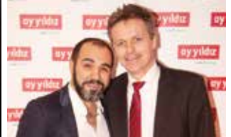
Tiyatro sanatçısı Adnan Maral ve Alfons Lösing