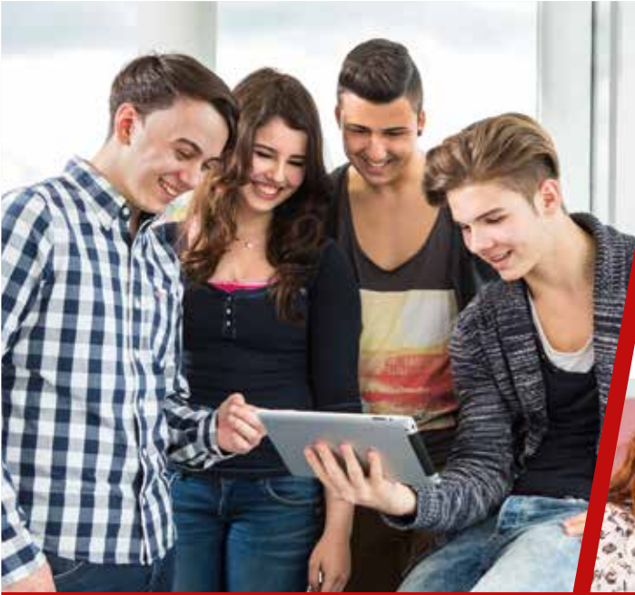
AY YILDIZ ile meslek hayatına başlangıç şimdi daha kolay