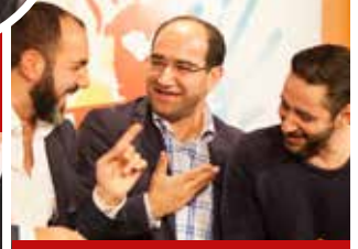
Tiyatro sanatçısı Adnan Maral, Politikacı Özcan Mutlu ve tiyatro sanatçısı Denis Moschitto